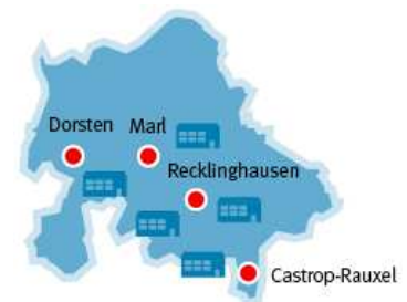
Fachschulen im Kreis Recklinghausen