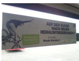
Werbung in Linienbussen September 2012

In allen AWO Kitas im Unterbezirk Münsterland-Recklinghausen, in Schulen, Jugendämtern, Berufskollegs und Bildungsbüros und zuletzt auch als Werbebotschaften in Linienbussen hängen die Poster und Postkarten aus.