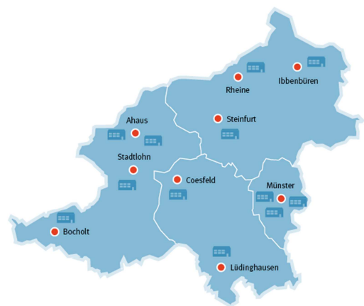
Fachschulen im Münsterland